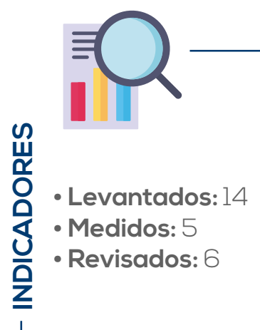
Tabla de procesos Levantados Tabla 1